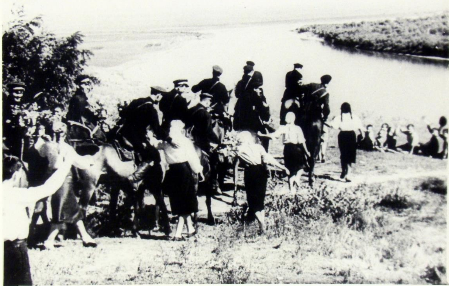
Проводы казаков на фронт. 1941 г.