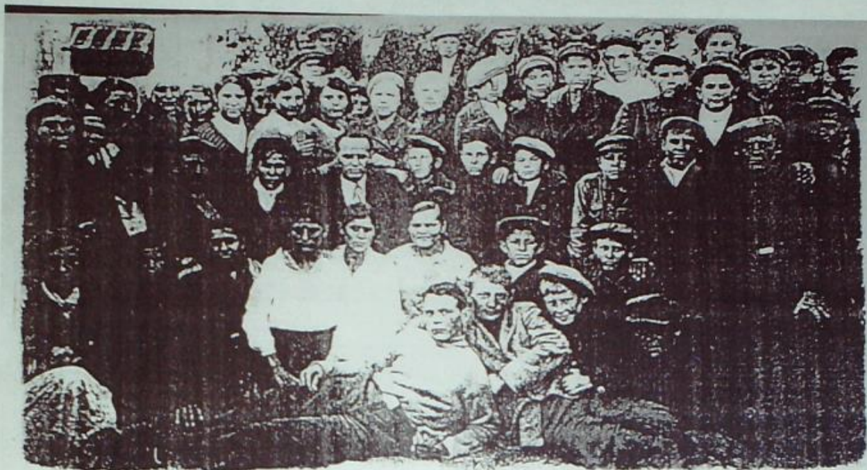
Цимлянская средняя школа 10"В"кл. октябрь 1941г. Все эти учащиеся 10"В" класса с июля 1941г. были зачислены и проходили службу во 2 ой взводе Цимлянского пограничного батальона (Н.С.В.Ф) периода ВОВ 1941-45 гг.

Цимлянская школа 10В .октябрь 1941.ЦРКМ НВ 295