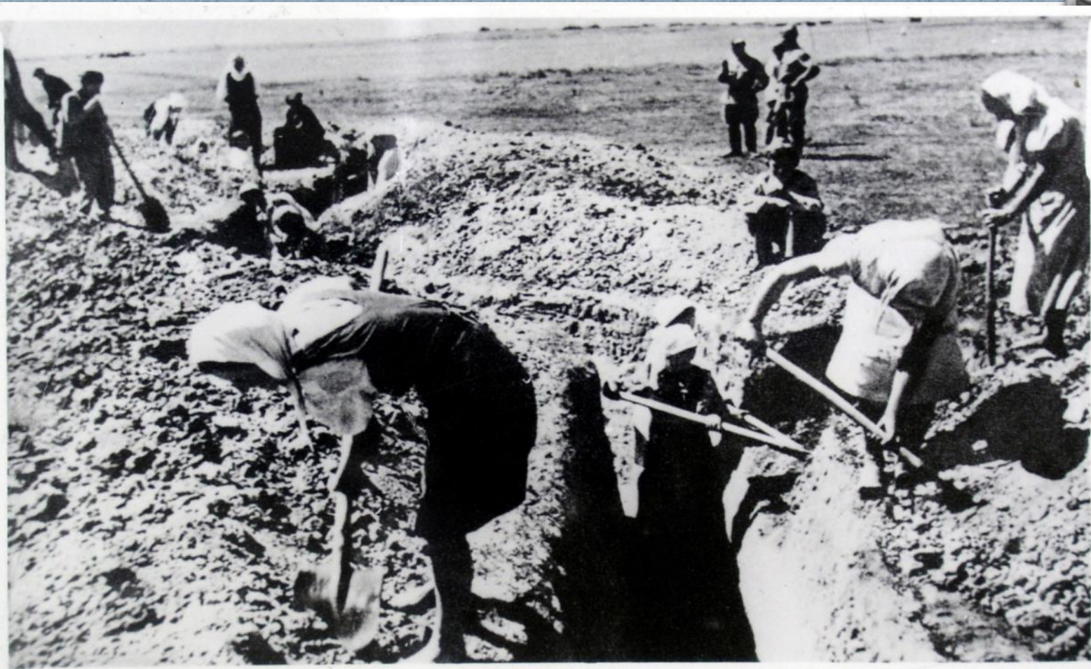
Жители донских станиц строят оборонительные сооружения. 1942 г.