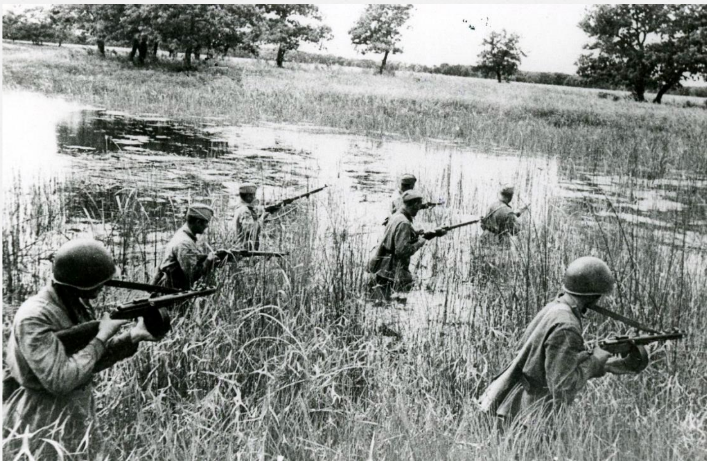
Советские бойцы форсируют водную преграду. 1942 г.