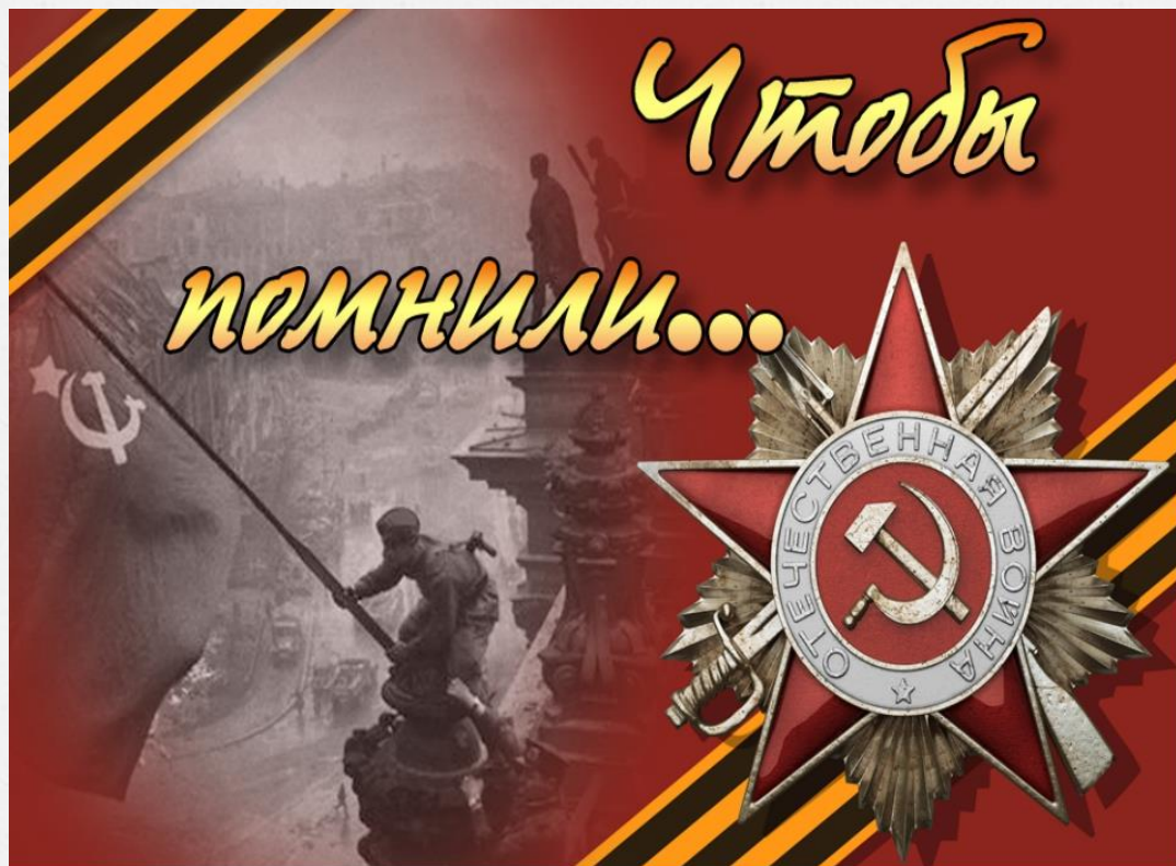
Великая Отечественная война 1941-1945гг.