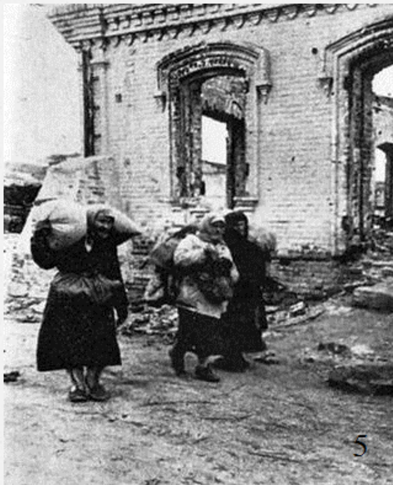
Жители станции Цимлянской возвращаются домой .Январь 1943.ГАРО ПА 2784.