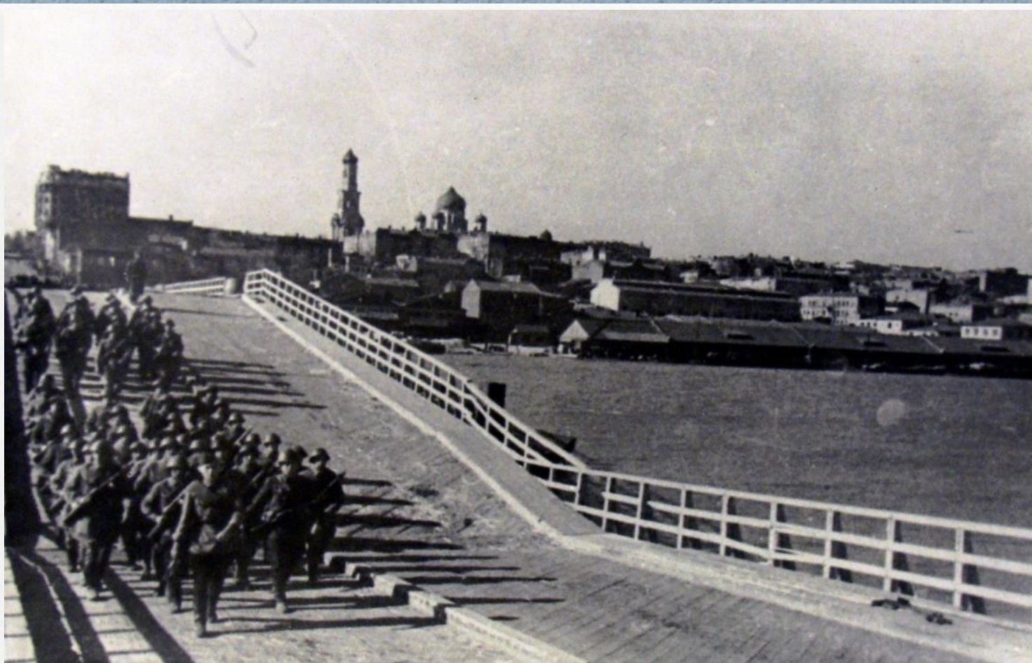
Части Красной армии. г.Ростов-на-Дону. 1941 г.