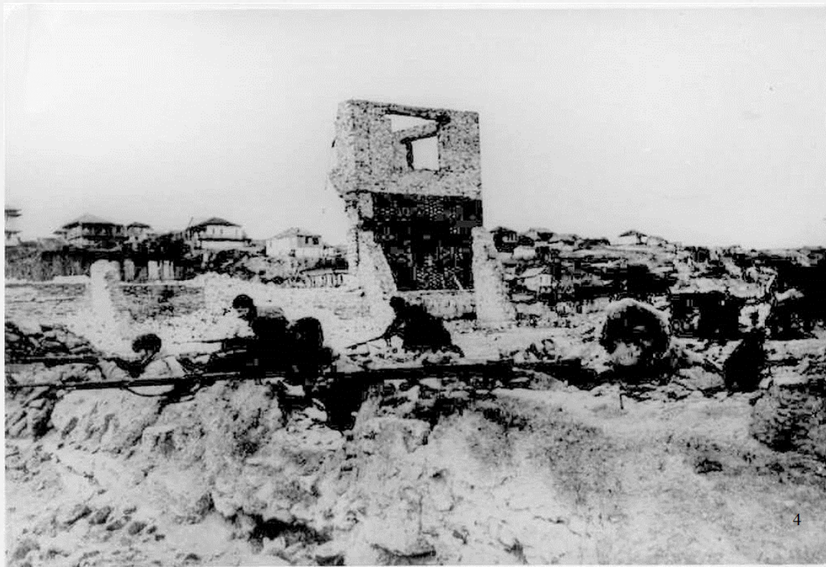
Цымла. Бои. 1 января 1943 года.